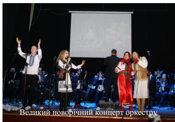
Великий новорічний концерт оркестру